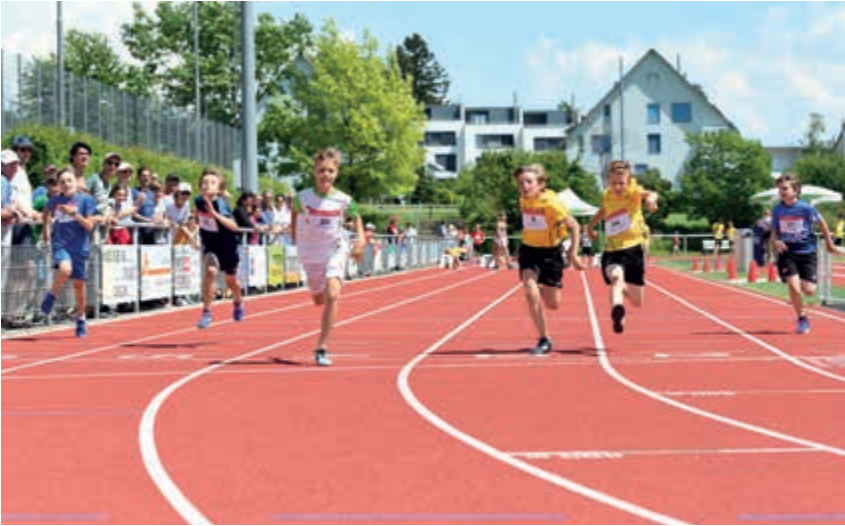
Rennen um den Titel «Schnellster Meilemer» auf der vom TSVM «erkämpften» Tartan-Rundbahn.

1972 wurde die Kommission in KK TSVM umbenannt, womit der Begriff «TSVM» Eingang in die Meilemer Sportszene fand. Schwerpunkte bildeten nun der Unterhalt des Vitaparcours, der seither im Jahresturnus von den TSVM-Vereinen geleistet wird, die Einführung der von der Schulpflege unterstützten Kinder-Sportkurse (Geräteturnen, Handball, Leichtathletik) und Lobbying für den Bau von Trainings- und Wettkampfanlagen. So wurde beispielsweise an der KK-Sitzung vom 19. Mai 1976 abgeprochen, wer an der bevorstehenden Gemeindeversammlung einen allfälligen Angriff der Opposition gegen den Kreditantrag des Gemeinderates über 500'000 Franken für eine Tartan-Rundbahn wie parieren sollte. Weiter wurde beschlossen, die Gründung einer Leicht-